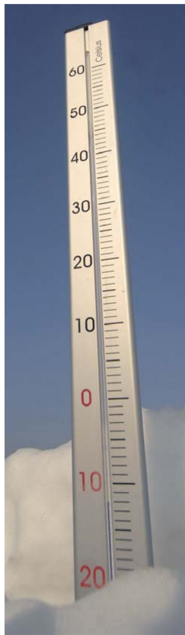
Thermometer im Schnee: Bei blauem Himmel zeigt die Skala minus zwölf Grad. Pfortner

Am heutigen 27. Januar wird der Opfer des Nationalsozialismus gedacht. Im Vorfeld dieses Tages haben gestern Abend Vertreter des Rates und der Verwaltung der Stadt Duderstadt am Mahnmahl „Gedenkstein Außenlager“ am Kreisell Industriestraße/Am Euzenberg einen Kranz niedergelegt. Der Gedenkstein erinnert an die 750 ungarischen Jüdinnen, die in den Poltewerken am Euzenberg als Häftlinge des Außenkommandos des Konzentrationslagers Buchenwald unter menschenunwürdigen Bedingungen arbeiten mussten. sr/SPF